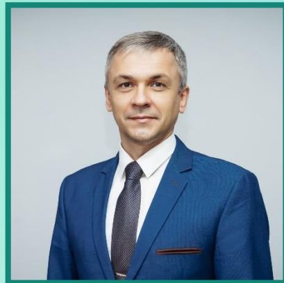
Ю.А. Трофимов Ректор ИрГУПС