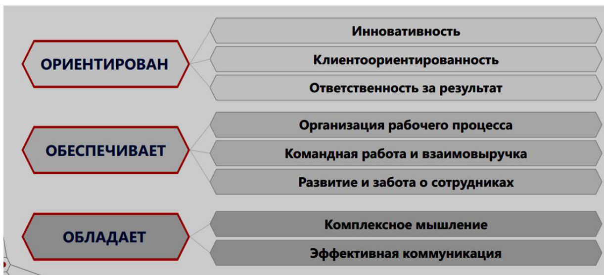
Рисунок 2 – Требования к сотрудникам в разрезе компетенций

В ЕКТ прописаны компетенции. Если профессиональные компетенции отличаются по каждой профессии, то корпоративные компетенции и для работника вокзала, и для проводника, и для машиниста, и для других профессий в компании РЖД будут общими – это умение работать в команде, дисциплинированность и ответственность, грамотная организация работы, соблюдение инструкций и регламентов. Только так можно обеспечивать безопасность перевозок.