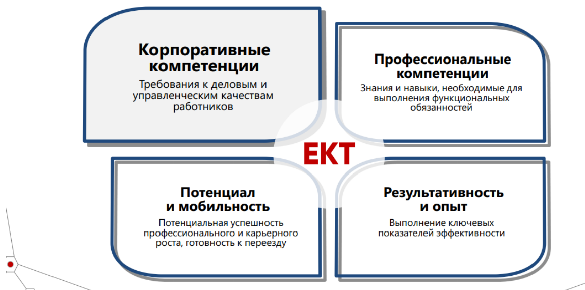
Рисунок 3 – Система ЕКТ