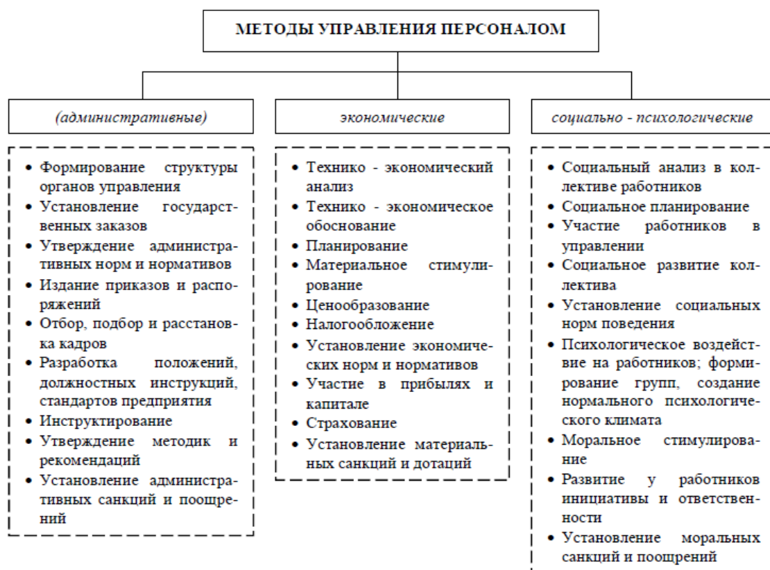
Рисунок 1- Система методов управления персоналом 3

Ситуация 6. Анализ текучести кадров на предприятии показал, что наибольший коэффициент текучести руководителей низшего звена управления наблюдается в одном из цехов. Выявленные причины текучести связаны с методами управления, используемыми начальником цеха. Он все руководство берет на себя, практически не делегируя полномочия подчиненным, сам решает организационные, производственные и экономические вопросы. Хотя его общение с коллективом цеха сведено к минимуму, он единолично определяет систему поощрения и наказания, занимается разрешением конфликтов. Все свои решения он проводит через приказы и распоряжения.