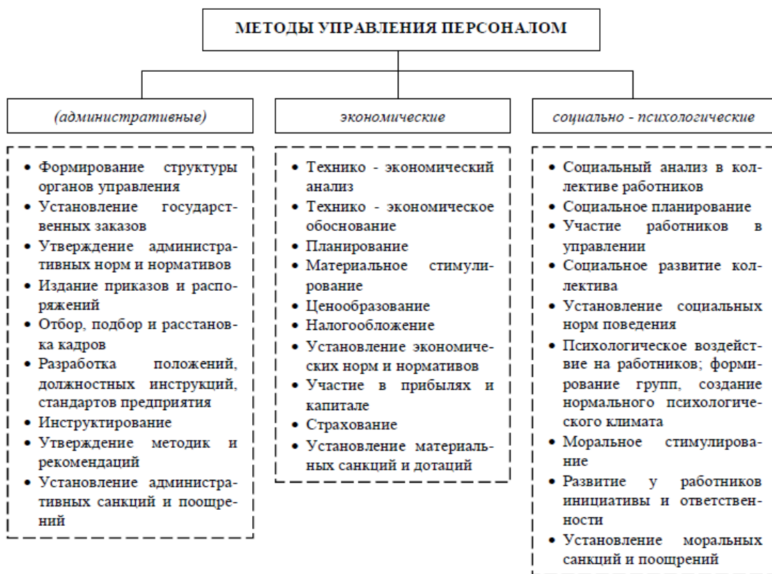
Рисунок 1- Система методов управления персоналом 3

Ситуация 6. Анализ текучести кадров на предприятии показал, что наибольший коэффициент текучести руководителей низшего звена управления наблюдается в одном из цехов. Выявленные причины текучести связаны с методами управления, используемыми начальником цеха. Он все руководство берет на себя, практически не делегируя полномочия подчиненным, сам решает организационные, производственные и экономические вопросы. Хотя его общение с коллективом цеха сведено к минимуму, он единолично определяет систему поощрения и наказания, занимается разрешением конфликтов. Все свои решения он проводит через приказы и распоряжения.