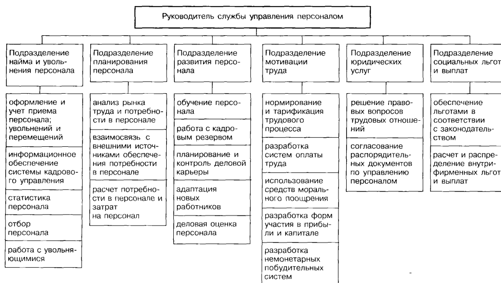
Рисунок 2 - Схема оргструктуры службы управления персоналом

Выбрав определенный вариант по табл. 1, необходимо рассчитать численность специалистов по управлению персоналом исходя из общей численности персонала организации. Затем общую численность службы управления персоналом следует распределить по ее подразделениям согласно варианту, выбранному по табл. 2