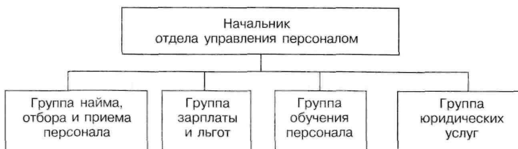
Рисунок 1 - Организационная схема отдела управления персоналом банка

2. На основе «Описания работы по должности» составьте должностные инструкции для менеджеров по этим должностям.