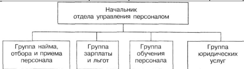
Рисунок 1 - Организационная схема отдела управления персоналом банка