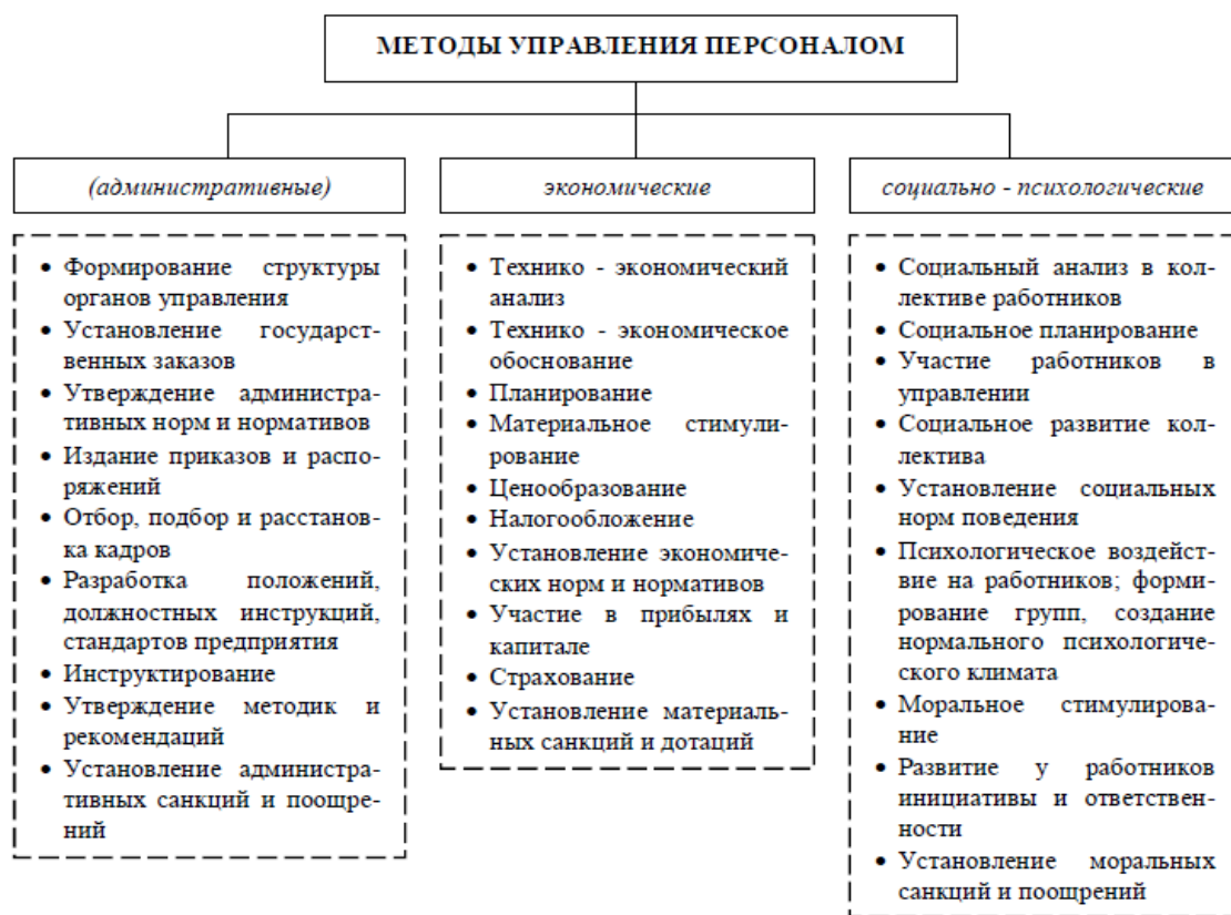
Рисунок 1- Система методов управления персоналом 3

Задание: 1. Какими методами управления пользовались руководители предприятий? 2. Сравните их. Почему, на ваш взгляд, второе предприятие стало сдавать свои позиции?