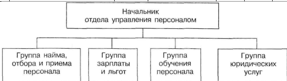
Рисунок 1 - Организационная схема отдела управления персоналом банка