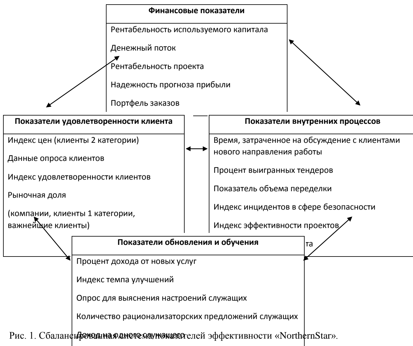
Рис. 1. Сбалансированная система показателей эффективности «NorthernStar».

Команда топ-менеджеров компании трансформировала миссию и стратегию «NorthernStar» в сбалансированную систему с четырьмя группами показателей (рис.1).