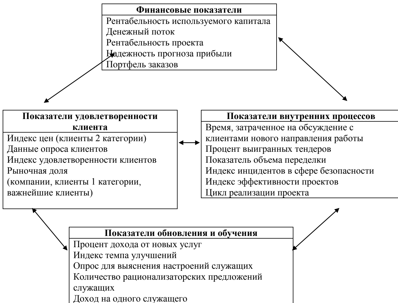
Рис. 1. Сбалансированная система показателей эффективности «NorthernStar».

Команда топ-менеджеров компании трансформировала миссию и стратегию «NorthernStar» в сбалансированную систему с четырьмя группами показателей (рис.1).