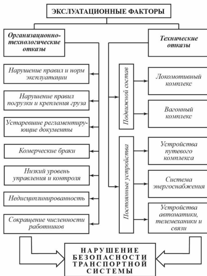
Рисунок 1.3. Эксплуатационные факторы, воздействующие на состояние безопасности ЖДТС

– технические, которые включают в себя исправность работы техники, оборудования, подвижного состава и всей инфраструктуры системы (рисунок 1.3).