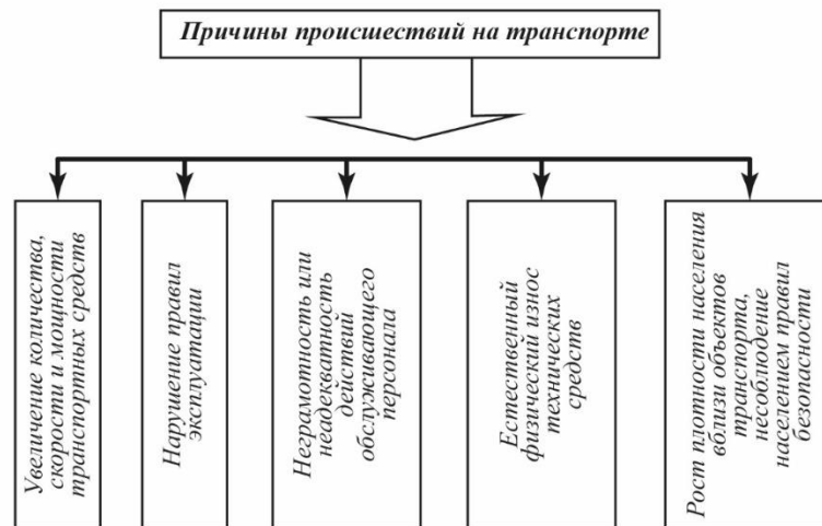
Рисунок 1.1. Причины возникновения транспортных происшествий