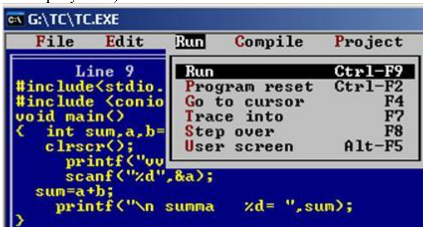
Рис. 2 Запуск программы на выполнение