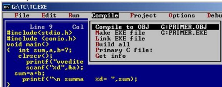
Рис. 1 Запуск программы на компиляцию

Во время компиляции выявляются синтаксические и логические ошибки.