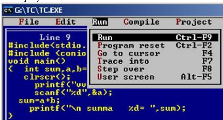
Рис. 2 Запуск программы на выполнение