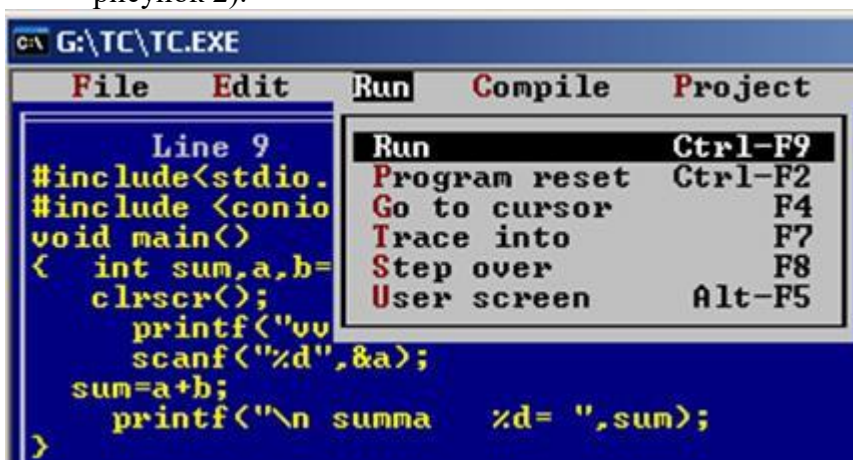
Рис. 2 Запуск программы на выполнение