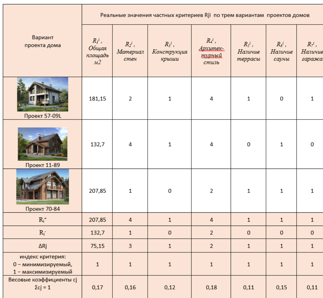
Таблица – Реальные значения частных критериев по каждому проекту