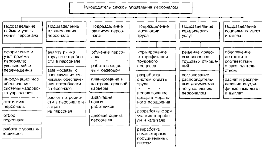
Рисунок 2 - Схема оргструктуры службы управления персоналом

Выбрав определенный вариант по табл. 1, необходимо рассчитать численность специалистов по управлению персоналом исходя из общей численности персонала организации. Затем общую численность службы управления персоналом следует распределить по ее подразделениям согласно варианту, выбранному по табл. 2