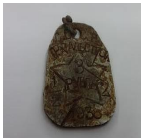
Деньги на БАМлаге