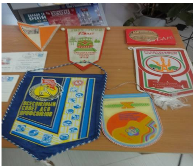
Эти конверты и вымпелы можно было потрогать руками