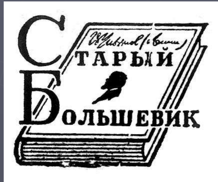
Книжная марка издательства