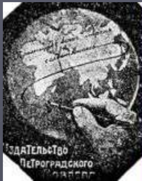
Книжная марка издательства