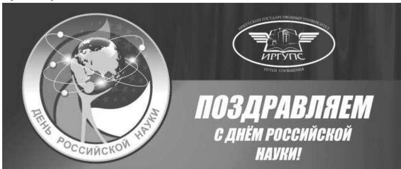
Рисунок 1 – Поздравление с Днем Российской Науки