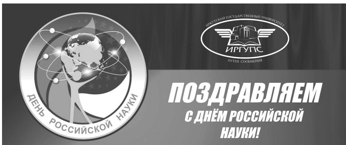
Рис. 1. Поздравляем с Днем Российской Науки

Изображения должны быть черно-белыми полутоновыми; не допускается их создание средствами MS Word. Пример приведен ниже.