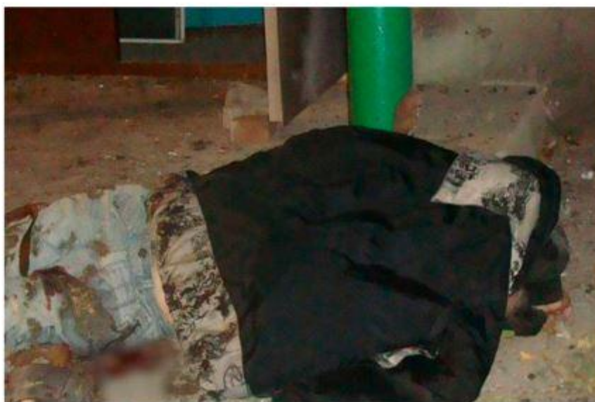
Погибший мирный житель 1976 г. р.

В Главном следственном управлении СК России возбуждено уголовное дело по факту организации представителями силовых структур Украины 27 октября 2016 г. артиллерийского обстрела из тяжелых видов вооружения неизбирательного действия жилых домов в Кировском районе г. Макеевки Донецкой области Украины, в результате которого погибли два человека, получили ранения различной степени тяжести пять человек, в том числе малолетняя София (ч. 3 ст. 33, ч. 1 ст. 356 УК РФ).