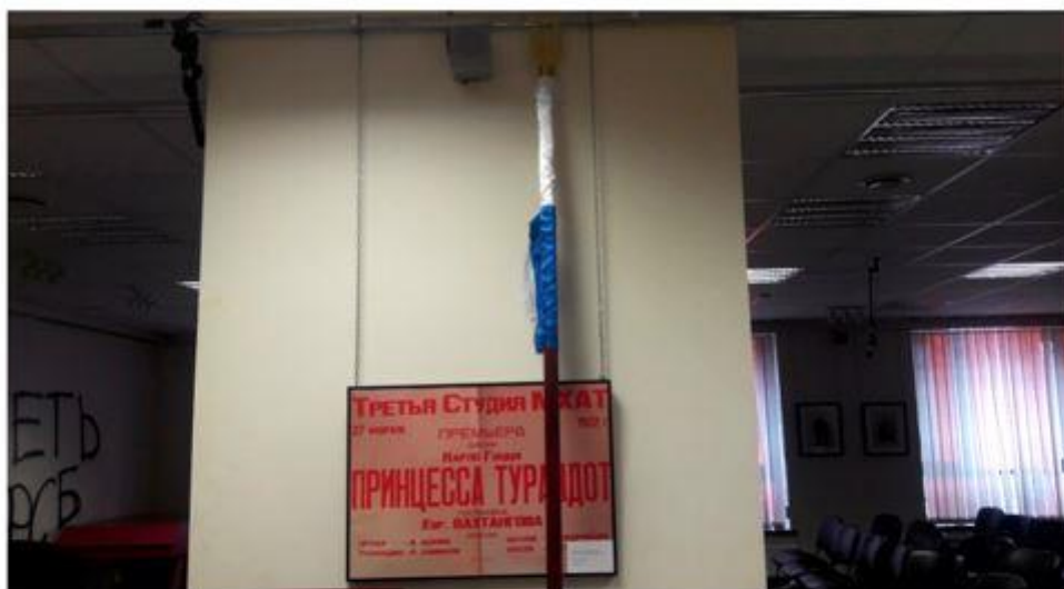
Надругательство над Государственным флагом Российской Федерации Российский центр науки и культуры, 17.02.2018