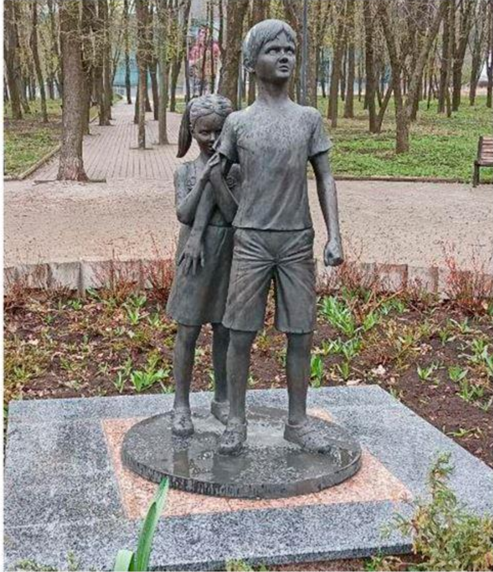
Памятник «Детям Донбасса, детям войны»