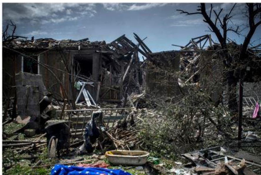
Станица Луганская, подвергшаяся авиационному удару Вооруженных сил Украины, 02.07.2014