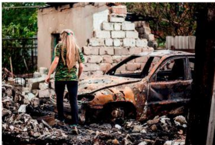
Снаряд прилетел прямо во двор, уничтожено все. К счастью, семья не пострадала ДНР, г. Никитовка. Май 2016 г.