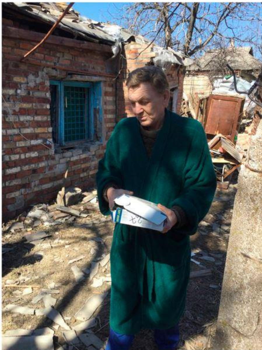
Попадание снаряда «Точки-У» в жилой дом Горловка, ДНР, 06 03 2022