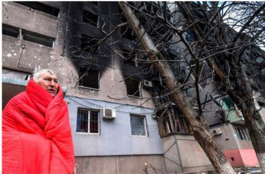
Житель дома на окраине Мариуполя. В городе отсутствуют вода и тепло, 17.03.2022