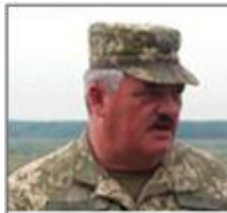
Локота Александр первый заместитель командующего Сухопутных войск ВСУ (2016 г.)