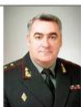
Бессараб Сергей заместитель начальника Генерального штаба МО Украины (с 2015 г. по март 2020 г.)