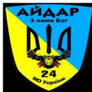
Эмблема батальона «Айдар»