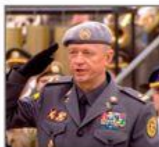
Лунев Игорь командующий Силами специальных операций Вооруженных Сил Украины (с 2016 г. по 2020 г.)