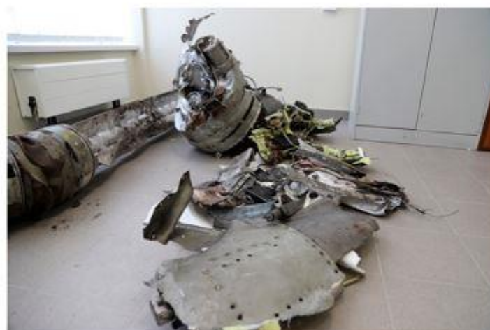
Часть тактического ракетного комплекса «Точка-У»

За восемь лет вооруженного конфликта на Донбассе зафиксировано не менее 13 случаев применения «Точки-У». По данным справочника Military Balance, в 2021 г. на вооружении Украины имелось до 90 таких пусковых установок и до 800 ракет 9М79 1 .