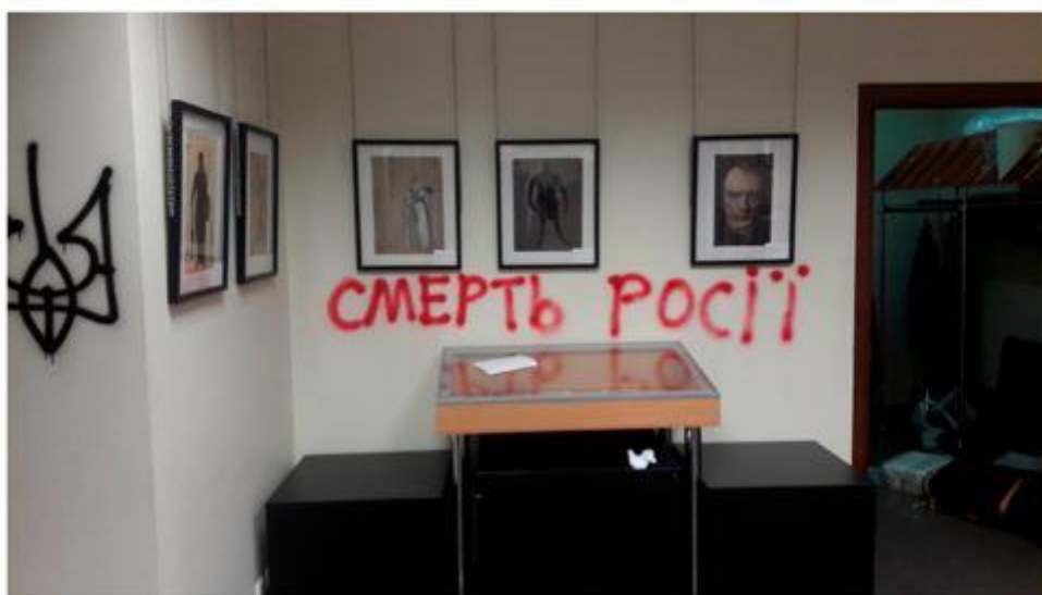
Антироссийские надписи, которые нанесли краской на стены агрессивно настроенные граждане Российский центр науки и культуры, 17.02.2018