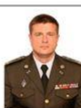
Бурба Василий начальник главного управления разведки МО Украины (с 2016 г. по 2020 г.)