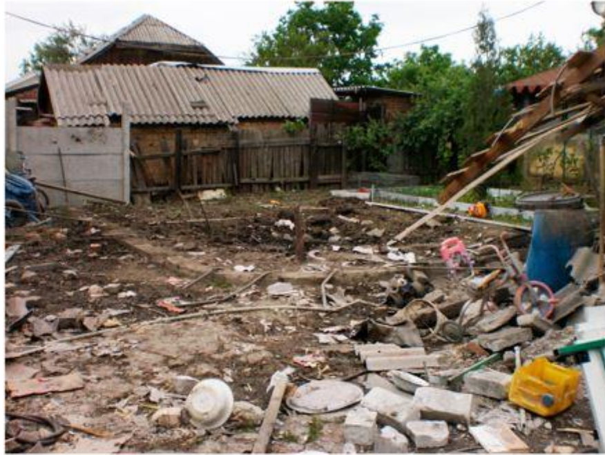
Воронка на участке семьи Тув, образованная взрывом