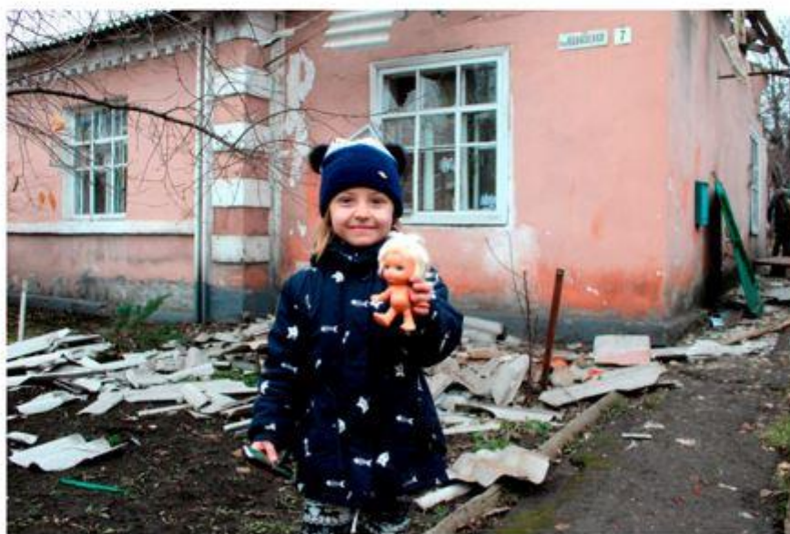
Юная жительница Первомайска у своего дома, разбитого снарядами ВСУ, не теряет детской жизнерадостности и надежды на мирную жизнь ЛНР, г. Первомайск. 13 декабря 2017 г.

В феврале 2022 г. в Луганске объявили эвакуацию. Собирались ночью, меньше чем за час сложили детские вещи и небольшой запас еды. Две недели жили в лагере для беженцев в Ростов-