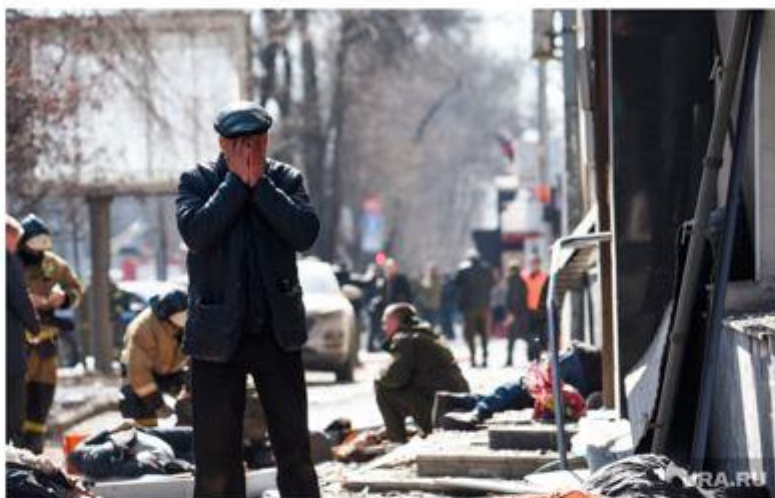
Взрыв в центре Донецка, 14.03.2022

В рамках уголовного дела следователями Главного следственного управления СК России устанавливаются конкретные украинские военнослужащие, которые исполняли незаконный приказ о применении против мирного населения запрещенного вооружения.