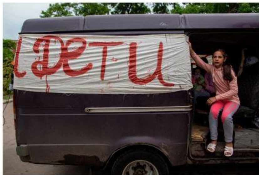
Дети в автомобиле. Жители города Славянска, который подвергается обстрелам украинскими силовиками, эвакуируют детей из города, 02.06.2014