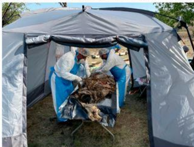
Работа на месте обнаружения массовых захоронений в ЛНР