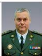
Наев Сергей командующий войсками Оперативного командования «Восток» Сухопутных войск ВСУ (с 2018 г. по 2019 г.)