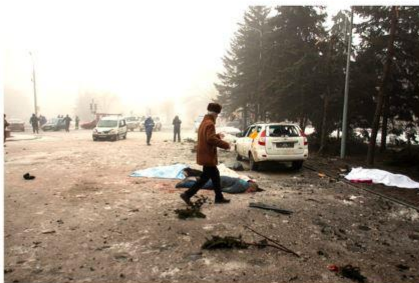
Последствия обстрела Донецка украинскими силовиками, 30.01.2015