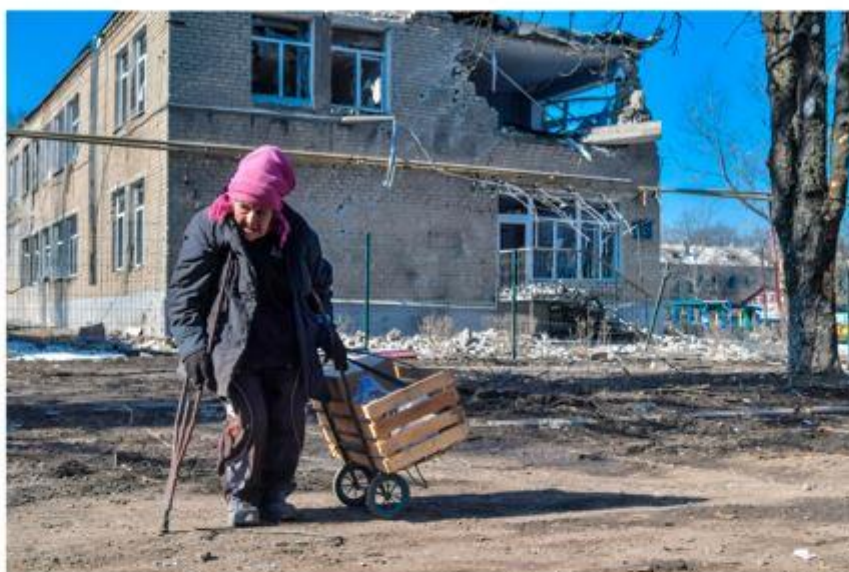
Местная жительница на улице в перешедшем под контроль ДНР городе Волновахе, 14.03.2022