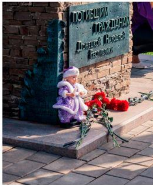
Жители Республики несут игрушки к монументу погибшим гражданам в память о детях, не переживших активную фазу боевых действий ДНР, Донецк. Лето 2015 г.