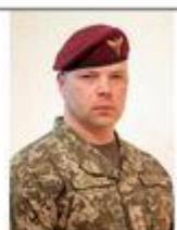
Забродский Михаил командующий Высокомобильными десантными войсками ВСУ (с 2015 г. по 2019 г.)