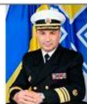
Воронченко Игорь командующий Военно-морскими силами Вооруженных Сил Украины (с 2016 г. по 2020 г.)