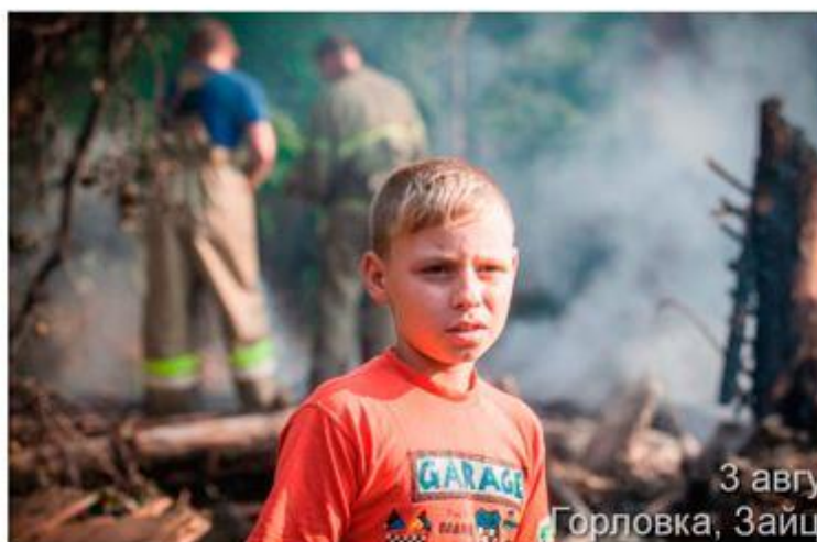
Пожарные тушат руины дома, где родился Сергей. Жилище было уничтожено ударом ВС Украины ДНР, Горловка, поселок Зайцево. 3 августа 2016 г.