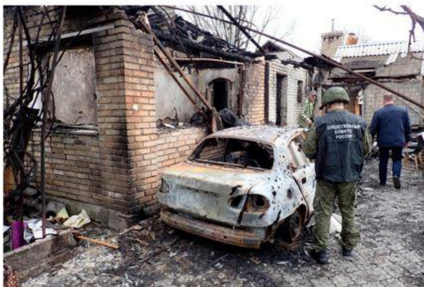
СК России зафиксированы последствия артиллерийского обстрела города Горловки украинскими военнослужащими, 19 04. 2022