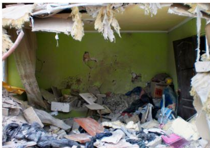
Разрушенный украинскими снарядами дом семьи Тув