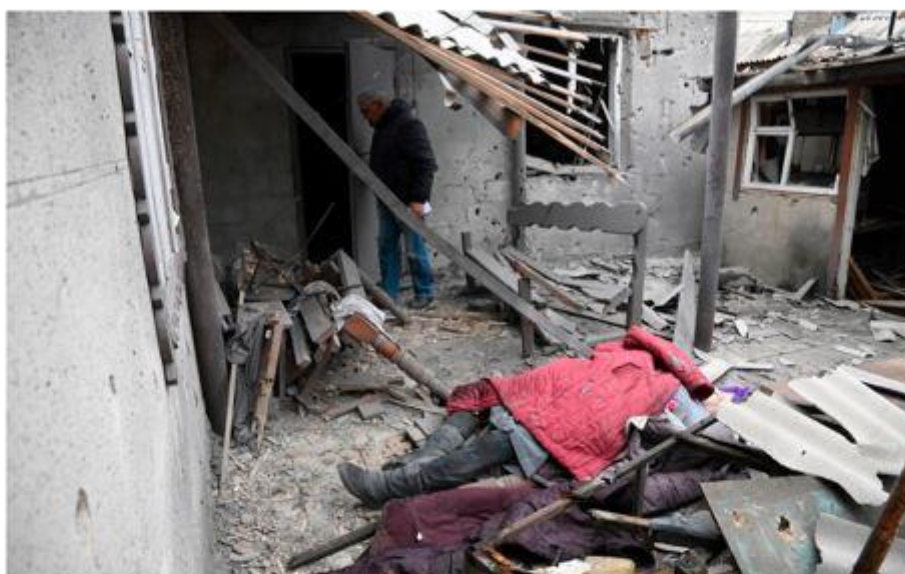
Тело женщины, погибшей в результате обстрела, во дворе своего дома на улице Тарханова в Донецке, 25.02.2022