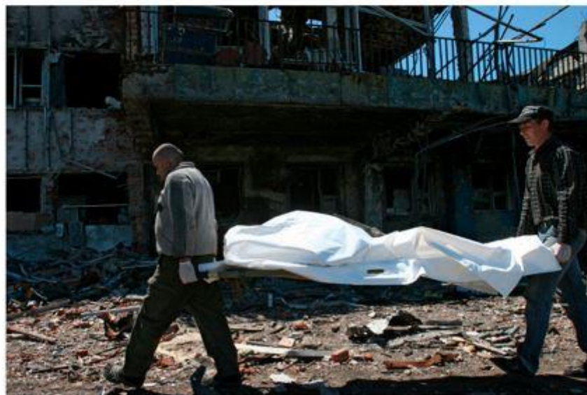
Волонтеры переносят останки украинского военного, извлеченные из-под завалов аэропорта Донецка, 22.05.2015