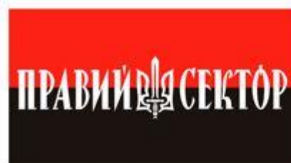
Эмблема батальона «Правый сектор»