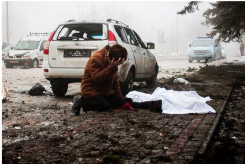
Отец плачет около тела дочери, погибшей в результате обстрела Донецка украинскими силовиками, 30.01.2015