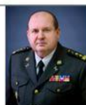
Попко Сергей командующий Сухопутными войсками Вооруженных Сил Украины (с 2014 г. по 2016 г.)