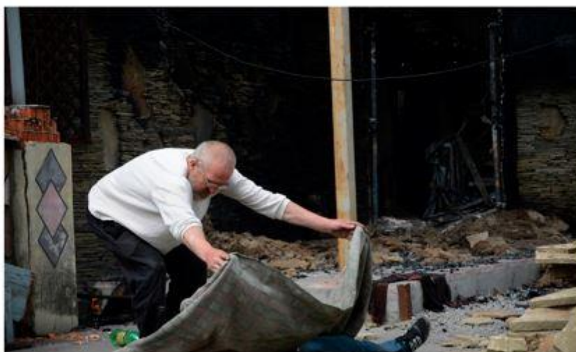
Жертва вооруженного столкновения в районе села Карловка Донецкой области, 23.05.2014