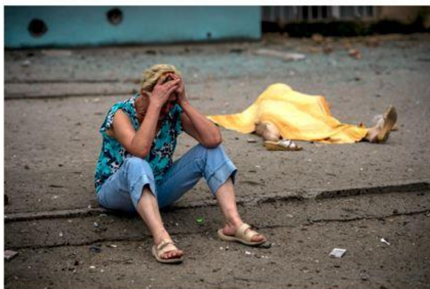
Жительница Луганска у тела погибшей во время артиллерийского обстрела города, 18.07.2014