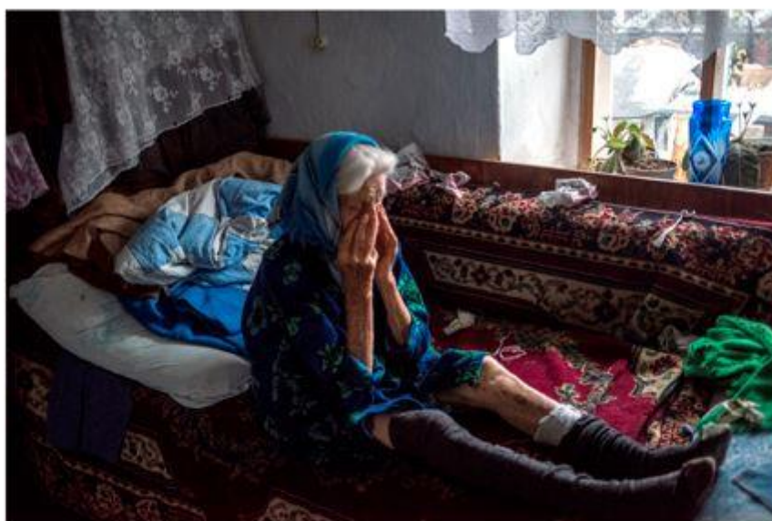
Местная жительница в одном из пострадавших от обстрела районов Новоазовского района Донецкой области, 18.11.2018