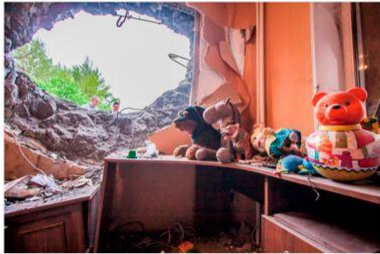
ДНР, Донецк. Май 2015 г.