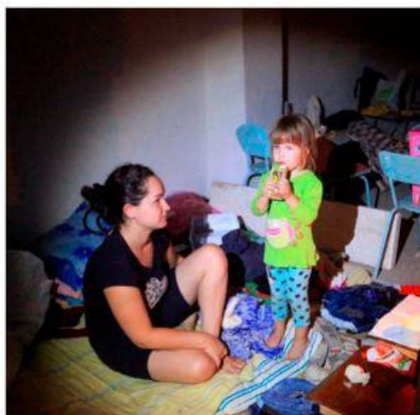
Матери успокаивали своих детей и укладывали их спать на холодном полу в подвалах многоэтажных домов ДНР, г. Ясиноватая. Август 2014 г.