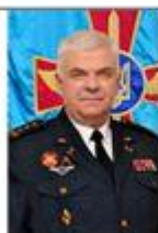
Дроздов Сергей командующий Воздушными силами Вооруженных Сил Украины (с 2015 г. по 2021 г.)