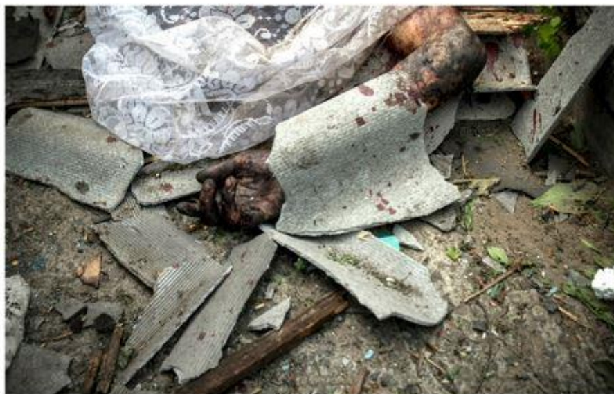
Тело местного жителя в станице Луганская, подвергшейся авиационному удару Вооруженных сил Украины, 02.07.2014