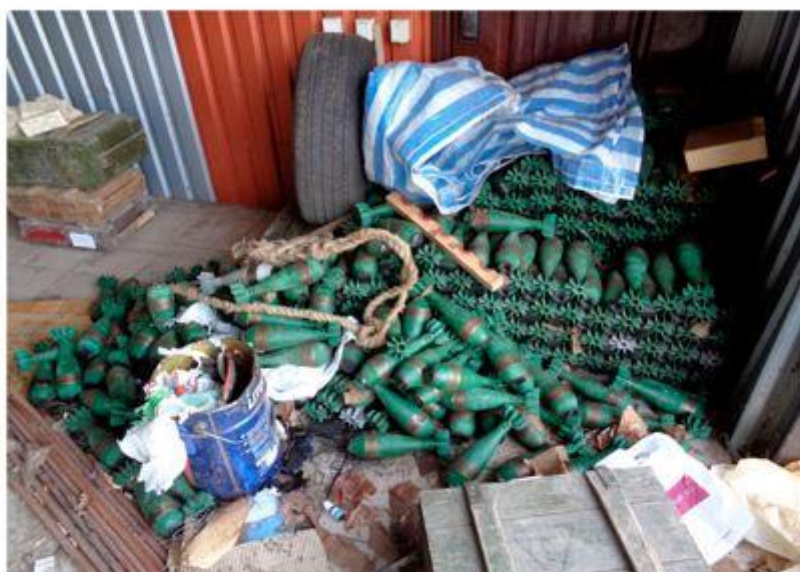
Схрон в месте дислокации националистов