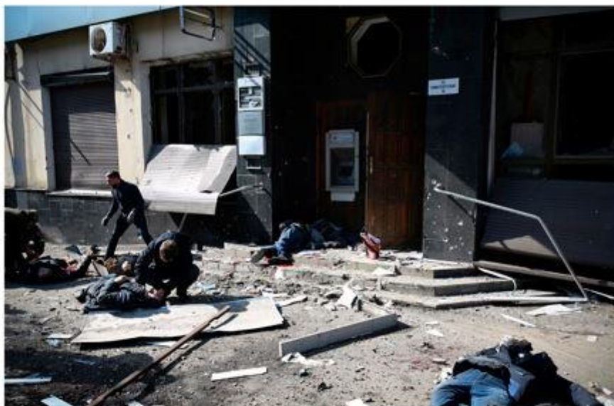
Удар в центре Донецка ТРК «Точка-У», 14.03.2022