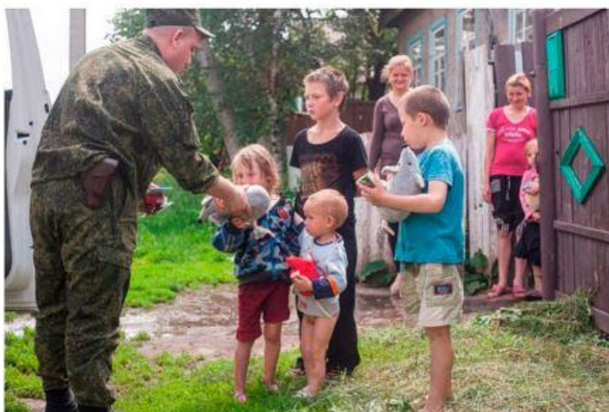
Военнослужащий Народной милиции дарит подарки детям прифронтового поселка ДНР, поселок Доломитное. Июнь 2016 г.