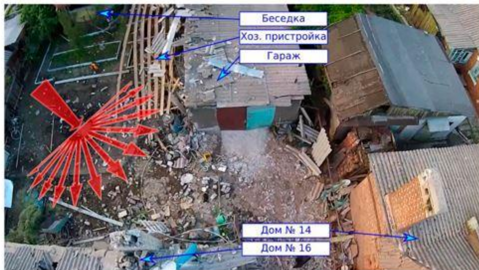
Схематичное изображение направления взрывной волны