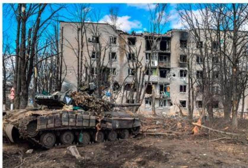
Уничтоженный украинский танк на улице в перешедшем под контроль ДНР городе Волновахе, 14.03.2022