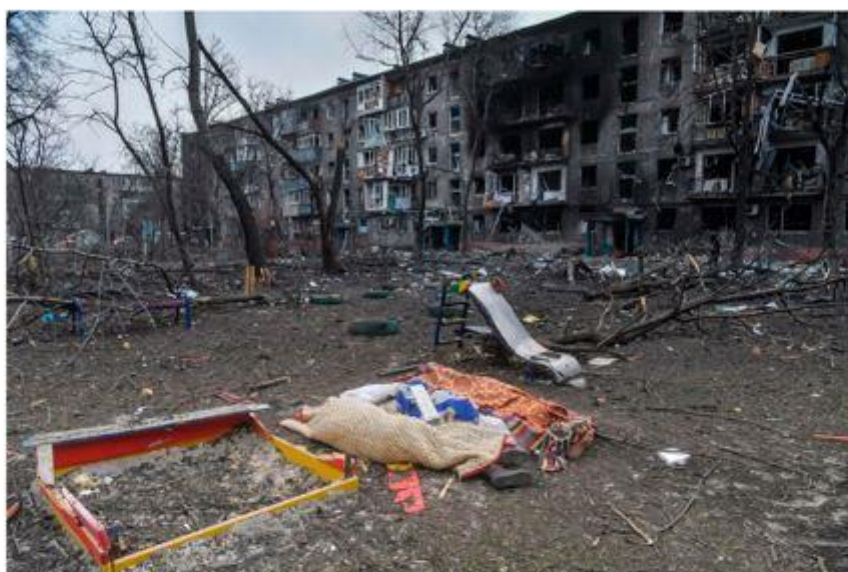
Тела погибших мирных жителей на детской площадке во дворе многоквартирных домов в Мариуполе, 17.03.2022