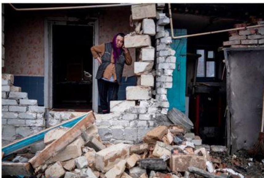
Последствия боевых действий в селении Трехизбенка