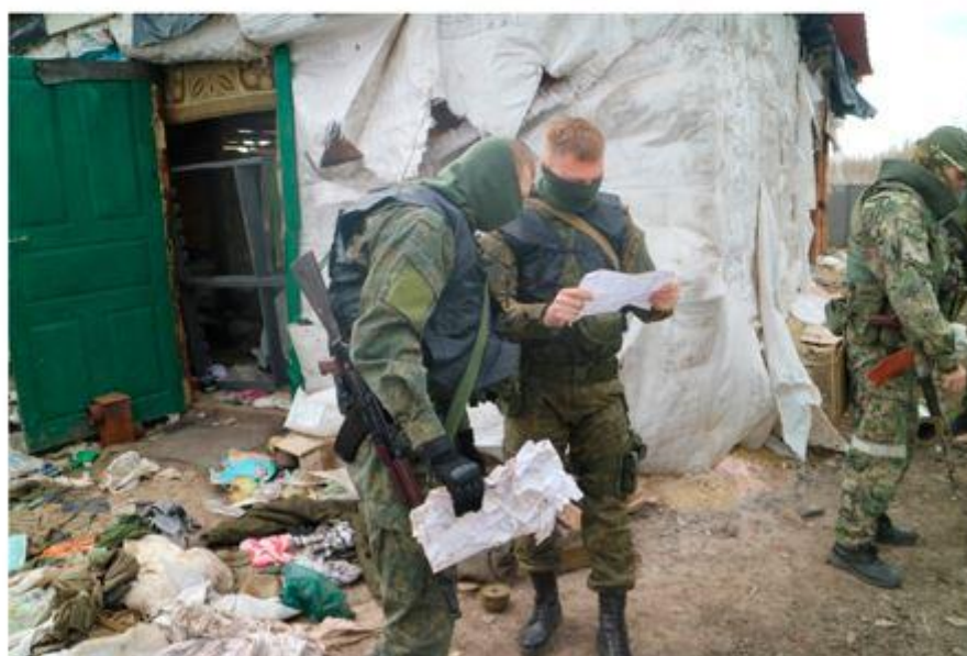
Следственные действия по уголовному делу о приготовлении к подрыву автомобильного моста на территории ЛНР в отношении военнослужащих ВСУ