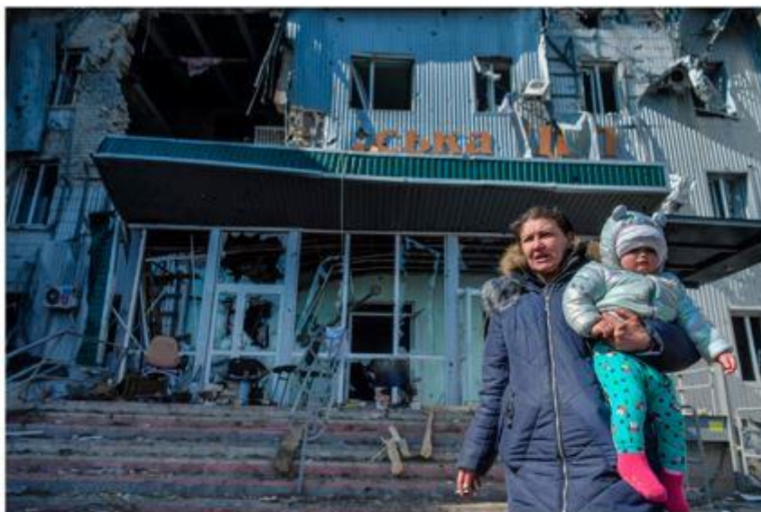
Женщина с ребенком у разрушенного здания поликлиники в перешедшем под контроль ДНР городе Волновахе, 14.03.2022