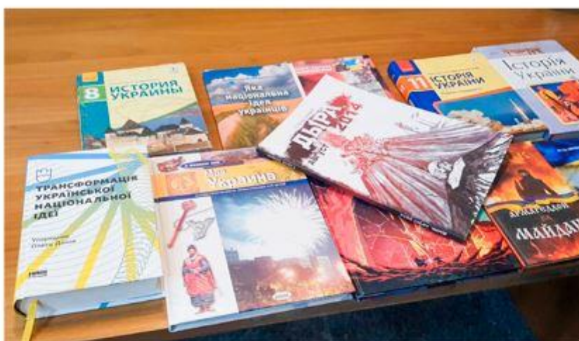
Националистическая литература, обнаруженная в детской библиотеке г. Волновахи в Донецкой Народной Республике после его освобождения от националистов

Так, пресс-секретарь компании сообщил о временном снятии компанией Meta на своих платформах в ряде стран запрета на призывы к насилию в отношении российских военных, назвав это формой политического самовыражения 1 . Важно подчеркнуть то обстоятельство, что такие призывы транслируются на многомиллионную аудиторию сетей Facebook и Instagram, которые используют как в России, так и на Украине. Граждане, подверженные влиянию информационных атак, неверно воспринимают цели и задачи специальной военной операции на территории Украины, что в конечном итоге призвано ослабить идеи национального единства. Поощрение подобных призывов со стороны компании Meta отражает консолидацию сил и ресурсов, подконтрольных американскому правительству против России. Действия компании наглядно демонстрируют всему миру тот факт, что правительство США в угоду своим интересам готово воздействовать на некогда свободные и независимые интернет-ресурсы.