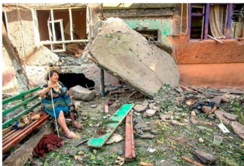
Жительница разрушенного в результате обстрела украинскими военными дома в Славянске и ее соседка, которая была убита, когда сидела на лавочке, 04.07.2014