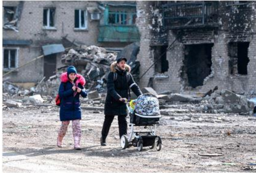
Жители Волновахи идут по улице города мимо разрушенного дома 15.03.2022