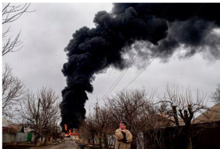
Пожар на нефтебазе в Луганске. По сообщениям представителей ЛНР, пожар произошел в результате нанесения удара по нефтебазе украинскими силовиками, 07.03.2022