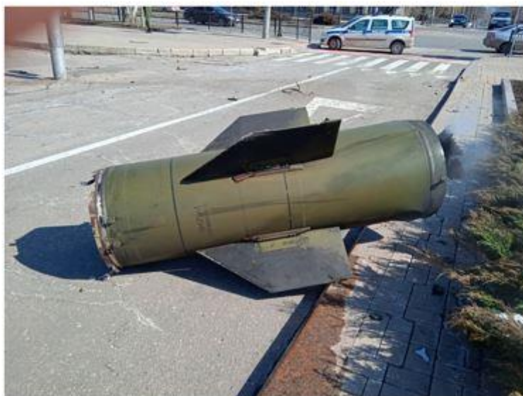
Из материалов уголовного дела

В рамках уголовного дела следователями Главного следственного управления СК России устанавливаются конкретные украинские военнослужащие, которые исполняли незаконный приказ о применении против мирного населения запрещенного вооружения.