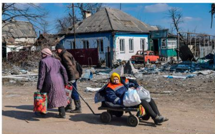
Местные жители на улице в перешедшем под контроль ДНР городе Волновахе, 14.03.2022