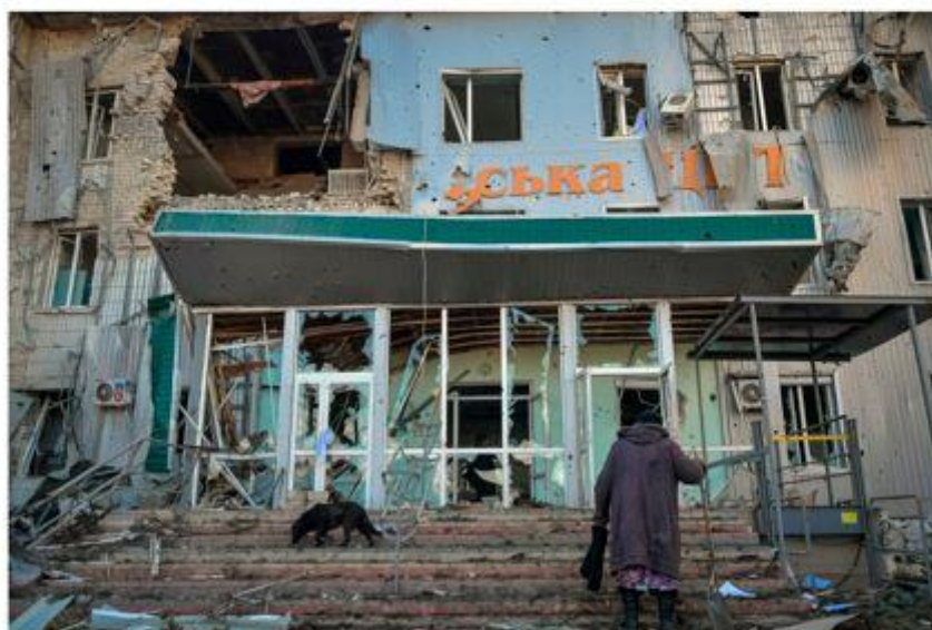
Женщина у здания городской больницы, разрушенного в результате обстрела в Волновахе, 12.03.2022