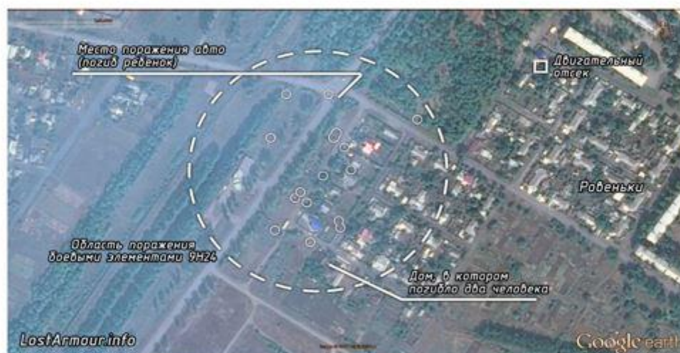
Спутниковый снимок с изображением мест поражения ТРК «Точка-У» Ровеньки, 22.08.2014