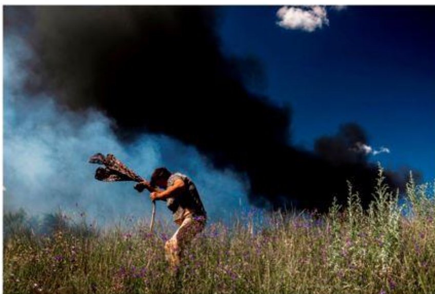
Местная жительница у автомобиля на трассе Луганск - Краснодар, загоревшегося в результате попадания снаряда во время обстрела украинскими силовиками, 20.07.2014