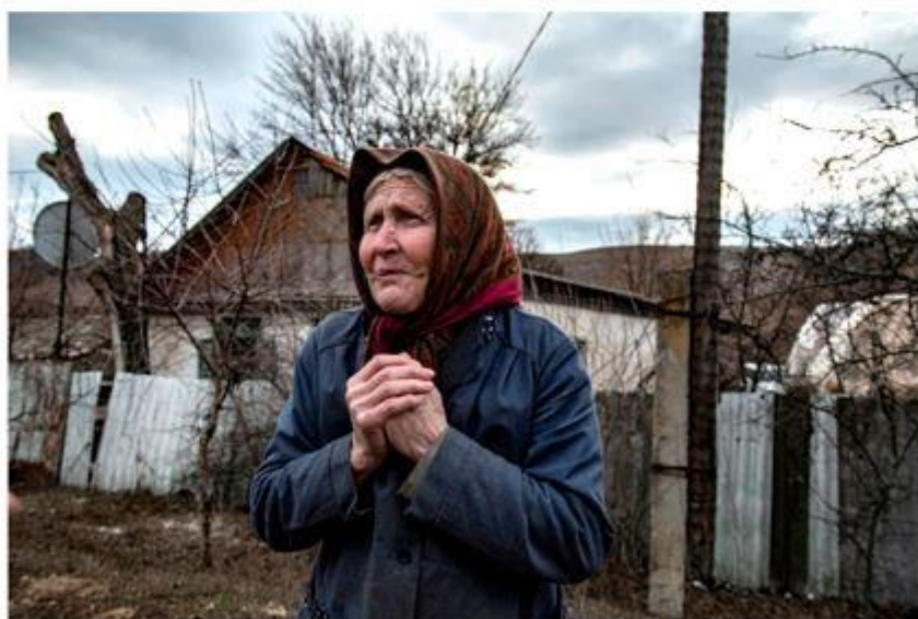
Местная жительница в одном из сел Луганской Народной Республики, 14.03.2022