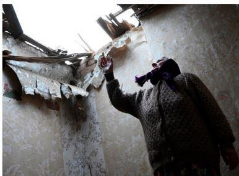
Местная жительница в одной из комнат своего дома, разрушенного после обстрела поселка Зайцево в Горловке, 24.02.2022