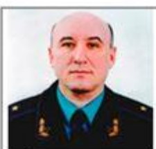
Хижий Владимир заместитель начальника Генерального штаба Министерства обороны Украины (2014 г.)