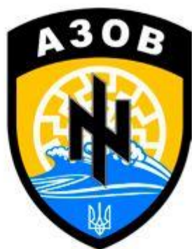
Эмблема батальона «Азов»