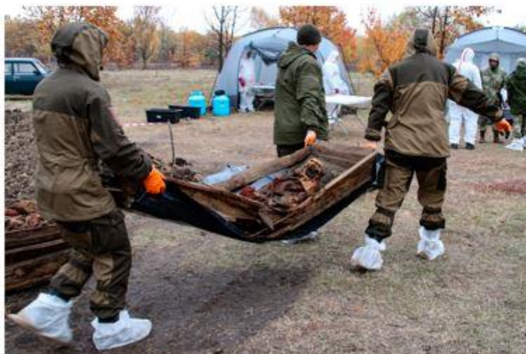
Работа на месте обнаружения массовых захоронений в ЛНР

Главным следственным управлением СК России по факту обнаружения захоронений расследуется уголовное дело по ч. 1 ст. 356 УК РФ – жестокое обращение с гражданским населением, применение в вооруженном конфликте средств и методов, запрещенных международным договором.