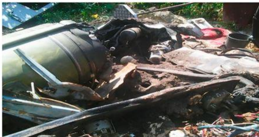
Попадание «Точки-У» по объектам гражданской инфраструктуры Ровеньки, 22.08.2014