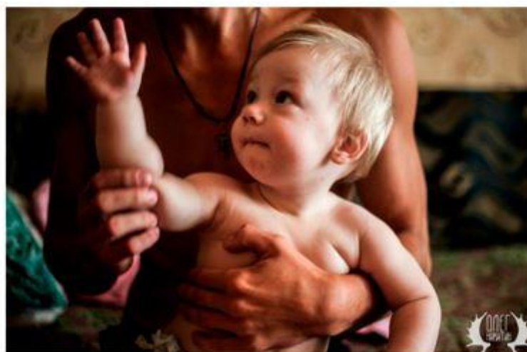
Этот малыш родился в самый разгар боевых действий, но он обязательно вырастет счастливым человеком ДНР, Горловка. Лето 2016 г.