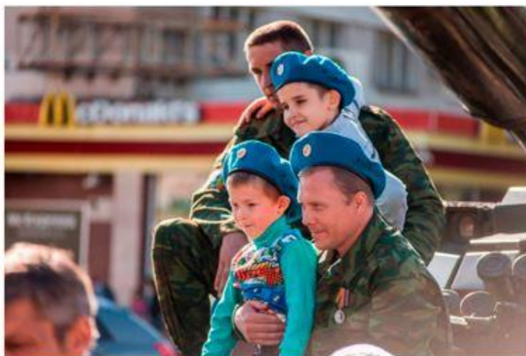
Донецкие дети с защитниками Республики. Первая годовщина со дня основания нового независимого государства ДНР, Донецк. 11 мая 2015 г.